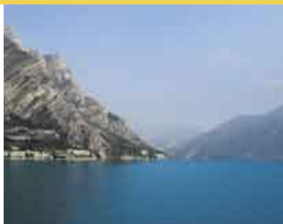
Gardasee Lago di Garda