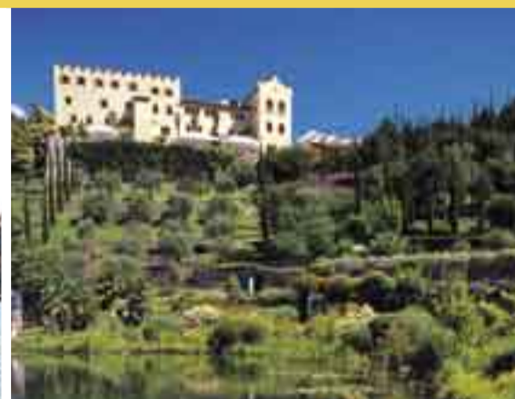
Meran – Gärten von Schloss Trauttmansdorff Merano – Giardini di Castel Trauttmansdorff

Unsere weiteren Ausflugsfahrten Sommer '10 Info und Reservierung Tel. 0471 601 073 www.tiersertal.com/hermobil