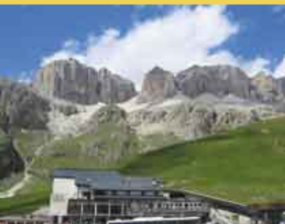
Dolomitenfahrt Giro delle Dolomiti